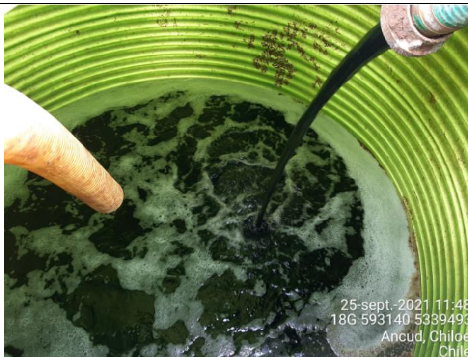
Fotografía N°13: Retiro de Lixiviados a estanque de acumulación. Tomada: Sábado 25 de Septiembre del 2021

Respecto a los retiros de lixiviados se mencionan en la siguiente tabla el cronograma y Cantidad de lixiviados retirados por jornada correspondiente a la semana del 20 al 26 Septiembre del 2021.