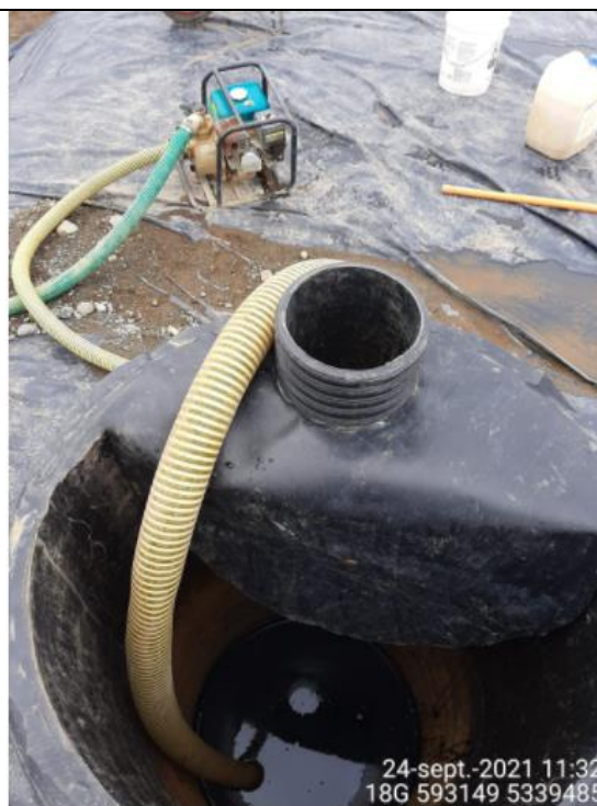
Fotografía N°11: Retiro de Lixiviados desde cámara C10 por personal Municipal. Tomada: Viernes 24 de Septiembre del 2021