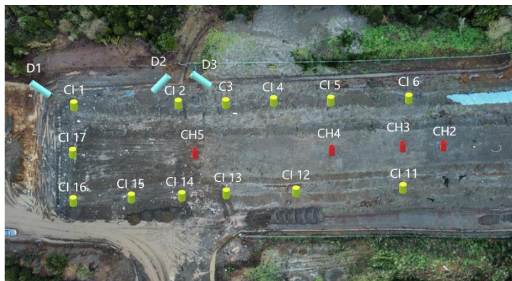
Fotografía N°15: Adecuación Zanja Sanitaria N°1- Parte Sur. Imagen Aérea