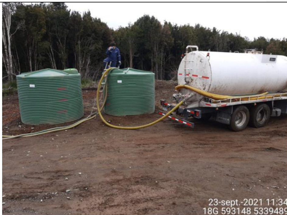
Fotografía N°8: Retiro de Lixiviados Zona norte por empresa Aconser. Tomada: Jueves 23 de Septiembre del 2021