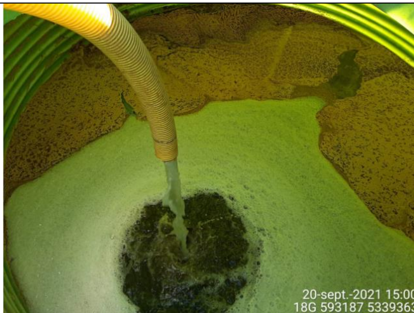
Fotografía N°2: Retiro de Lixiviados a estanque de acumulación por Personal Municipal. Tomada: Lunes 20 de Septiembre del 2021.