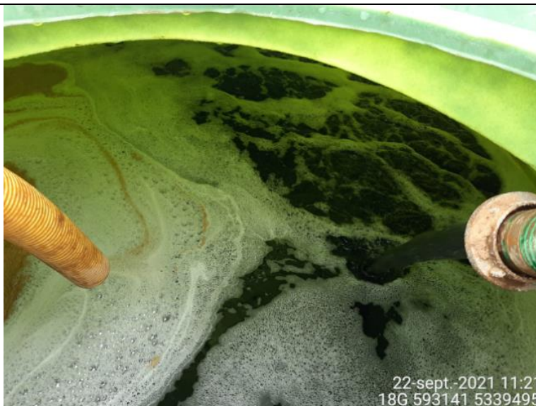
Fotografía N°6: Extracción de Lixiviados desde diagonales C10 por Personal Municipal. Tomada: Miércoles 22 de Septiembre del 2021