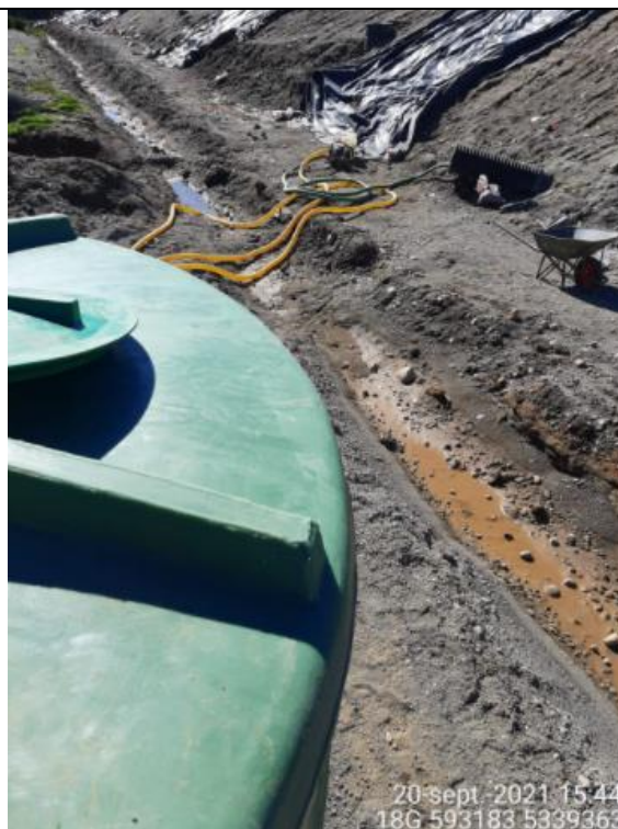
Fotografía N°3: Retiro de Lixiviados desde diagonal D2 por Personal Municipal. Tomada: Lunes 20 de Septiembre del 2021.