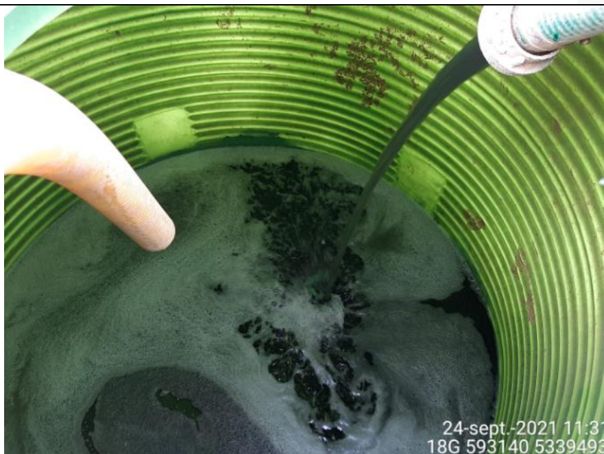
Fotografía N°10: Retiro de Lixiviados a estanque de acumulación por personal Municipal. Tomada: Viernes 24 de Septiembre del 2021