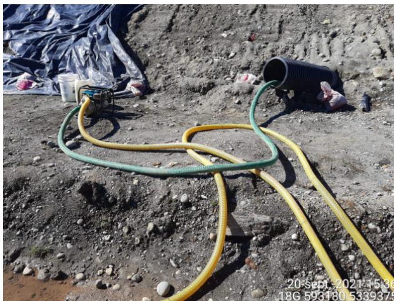
Fotografía N°1: Retiro de Lixiviados desde diagonal D3 por Personal Municipal. Tomada: Lunes 20 de Septiembre del 2021.

Para dar cumplimiento a lo indicado en Res. Exenta N°2070, emitida con fecha 16 de Septiembre del 2021. A continuación se presenta el registro fotográfico de las actividades de extracción de la semana que contempla el presente reporte. Lo correspondiente a los días 17-19 no se incluyen ya que fueron abordados en reporte de cumplimiento anterior, además que dichos días eran feriados irrenunciables, por lo que se comienza a detallar actividades desde el 20 de Septiembre.