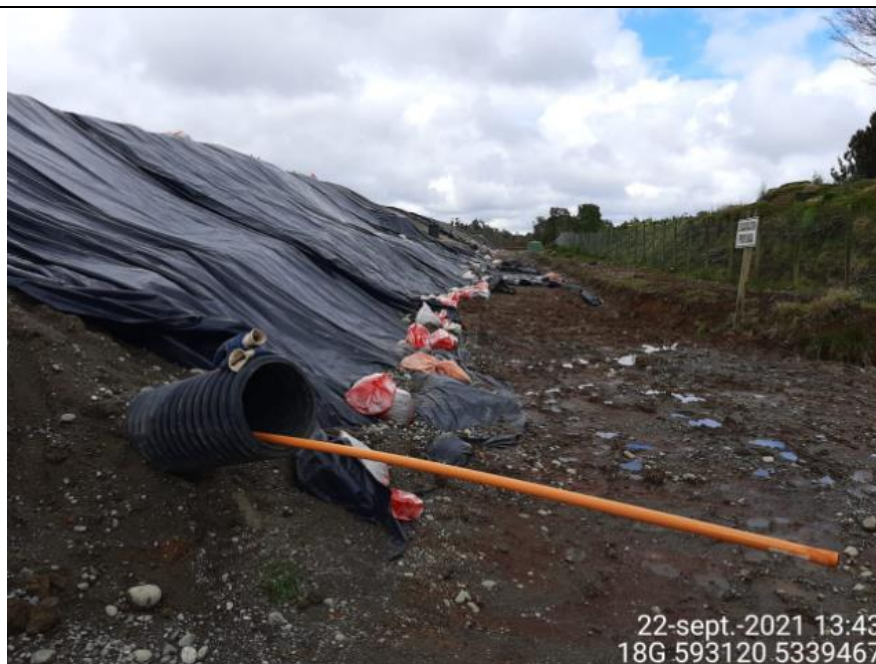
Fotografía N°16: Medición de Niveles de cámaras de inspección por Personal Municipal.

Tomada: Miércoles 22 de Septiembre del 2021.