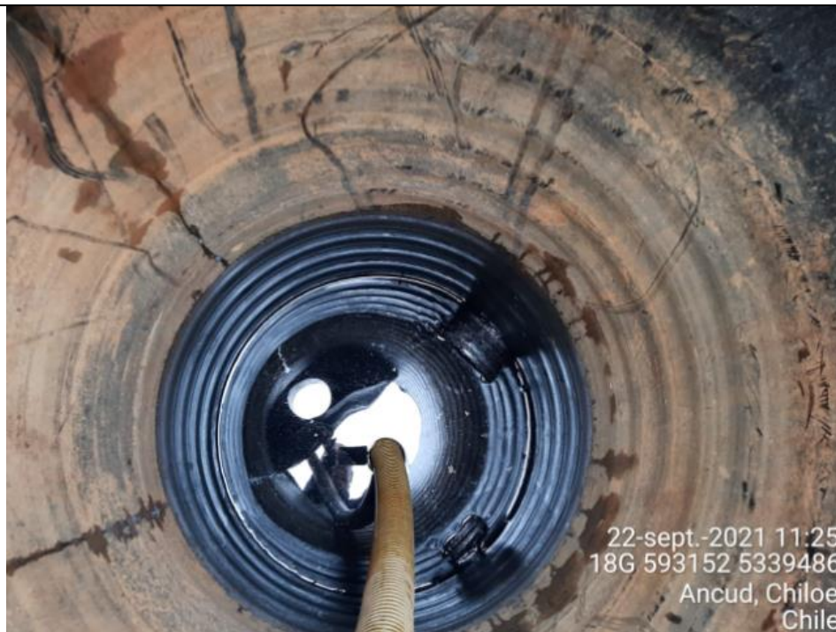
Fotografía N°5: Retiro de Lixiviados desde cámara C10 por Personal Municipal. Tomada: Miércoles 22 de Septiembre del 2021.