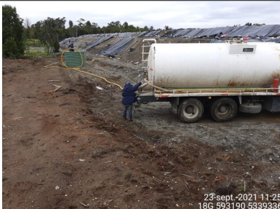
Fotografía N°9: Retiro de Lixiviados Zona adecuación por empresa Aconser. Tomada: Jueves 23 de Septiembre del 2021