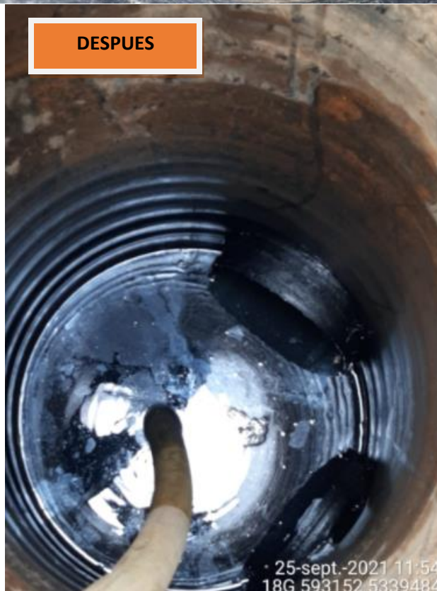
Fotografía N°12: Retiro de Lixiviados desde cámara C10 Antes y Después de extracción. Tomada: Sábado 25 de Septiembre del 2021