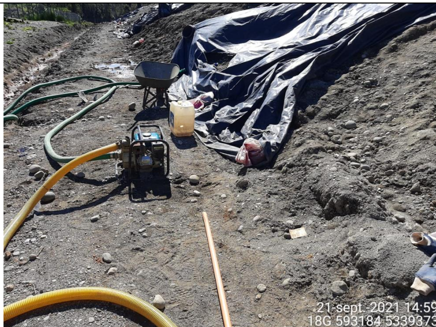
Fotografía N°4: Extracción de Lixiviados desde diagonales. Tomada: Miércoles 21 de Septiembre del 2021.